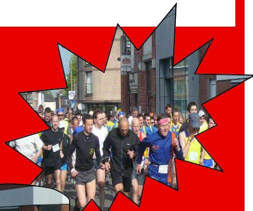
Grand Prix des Sylves